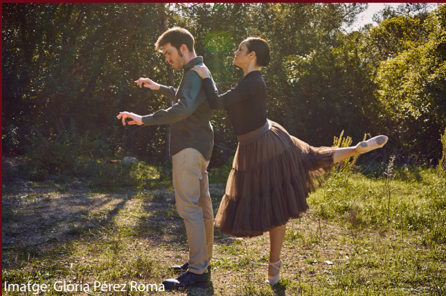
Imatge: Glòria Pérez Roma